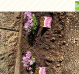
→仕事でのリラックスは庭の ガーデニングを見ること

利用者の皆さんへ…ぜひシャロームで過ごす1日1日を、できるだけ大切にしてみてください。私も実感があるのですが、2年間はあっという間です。ちょっとした雑談やおいしいお弁当を食べたことなど、当たり前の毎日を、大切に。それが、後になってとっても素敵な思い出になっていると思いますよ。